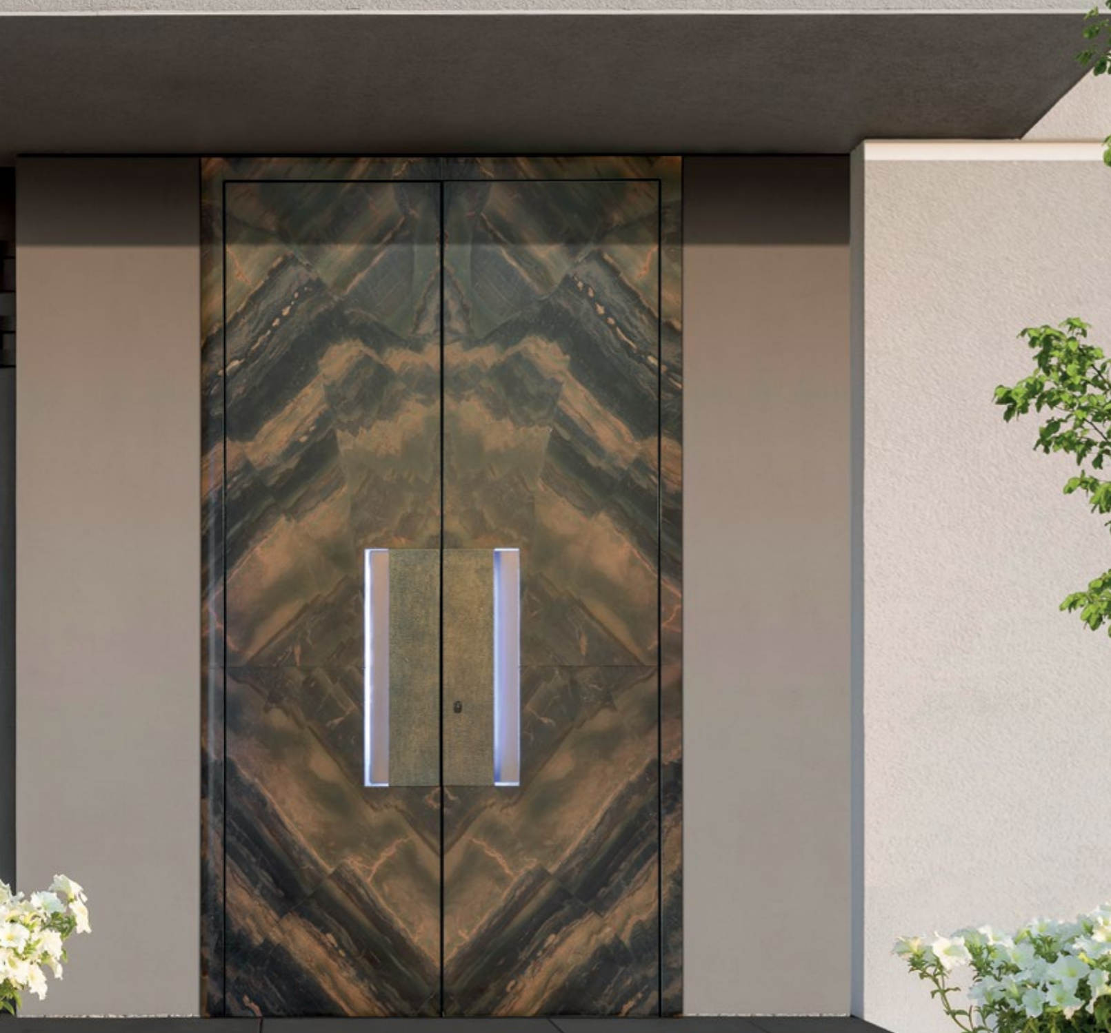
КАМЕНЬ II (КАМЕНЬ, СТЕКЛО ИЛИ КЕРАМИКА – ВОЗМОЖНО ВСЕ)