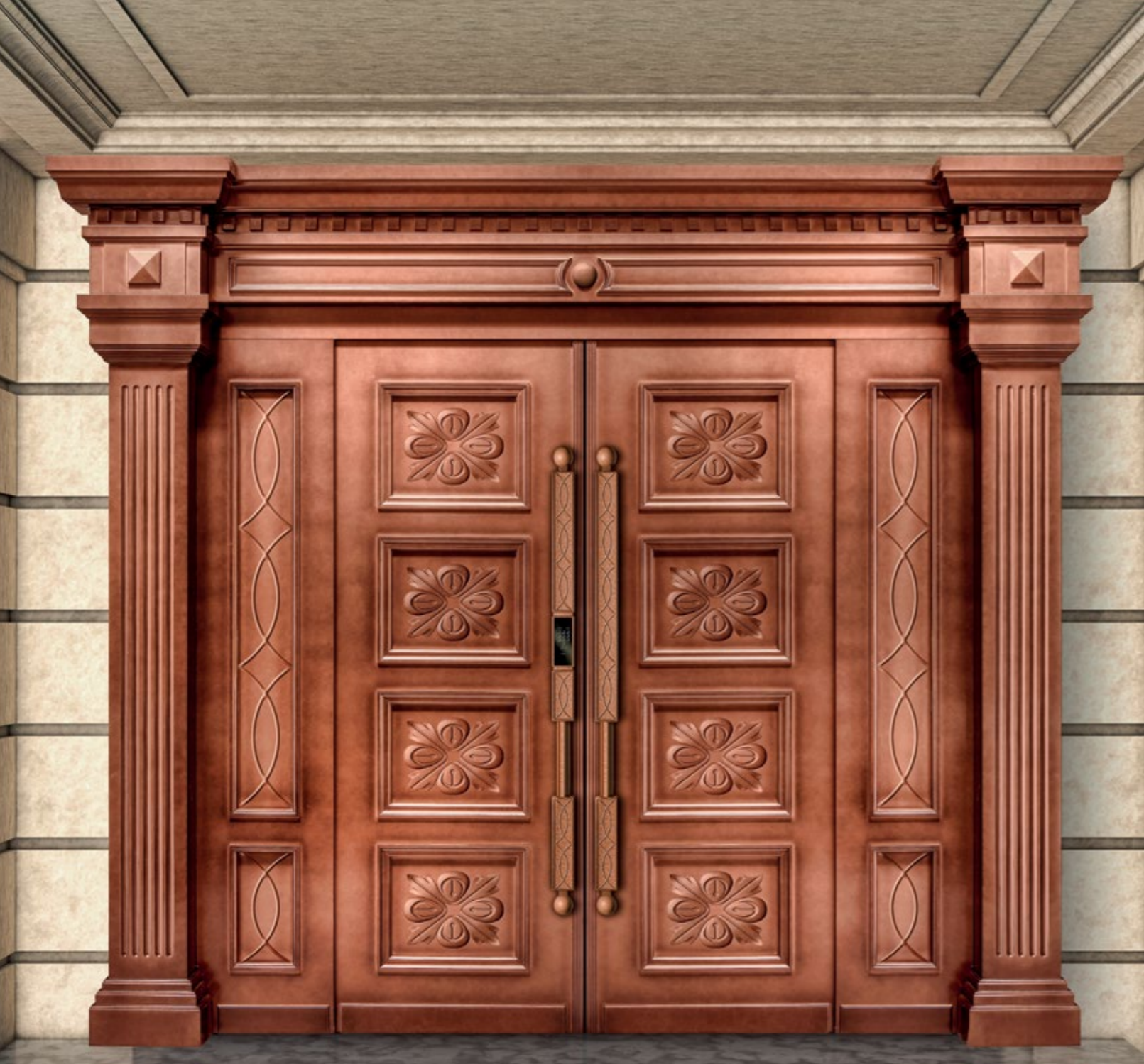
ПОРТАЛ КЛАССИКА I (КОНЦЕПЦИЯ)