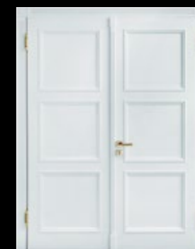
Внутренняя сторона двери в классическом стиле

Мастерство и традиции, движимые страстью. Мастерство экспертов в сочетании с самыми современными технологиями производства обеспечивает основу для создания дверей высшего класса. Наружные двери ComTür разработаны для экстремальных погодных условий с жесткой на кручение конструкцией двери, чтобы противостоять ветровым нагрузкам, воздухопроницаемости и обеспечить плотное прилегание, препятствуя проникновению дождя.