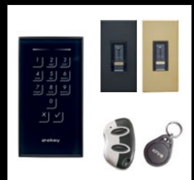
Сенсорная панель и система отпечатков пальцев в различных цветах

Все автоматические функции и система автоматического запирания ComTür могут управляться с помощью отпечатка пальца, транспондера или миниатюрного передатчика. Для удержания в открытом положении, если требуется, существует ряд различных систем закрывания дверей верхнего монтажа (с дверным стопором) на выбор.